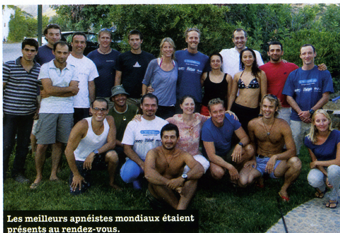
Les meilleurs apnéistes mondiaux étaient présents au rendez-vous.

La deuxième semaine, la pression monte. La compétition débute le 25 juillet et dure trois jours. Les pointures de l'apnée